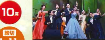
[ステージ写真はイメージです]