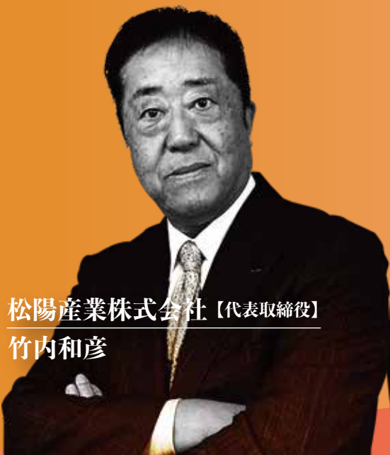
松陽産業株式会社【代表取締役】

昭和とZ世代の経営者が、豊富な経験と新しい視点からビジネスの未来を共に探ります。