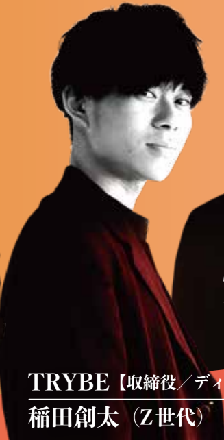
TRYBE【取締役/ディレクター】