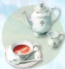
*イラストはイメージです