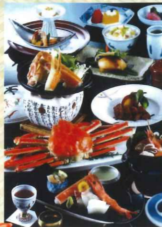
料理はイメージ写真です