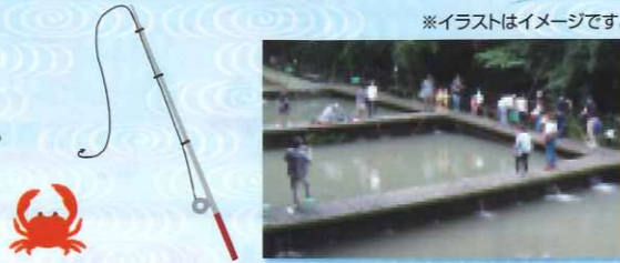
*イラストはイメージです。

申込方法 このページをコピーして下記申込用紙に必要事項を記入してFAXしてください。