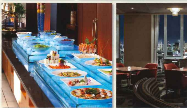
※料理写真はイメージです。